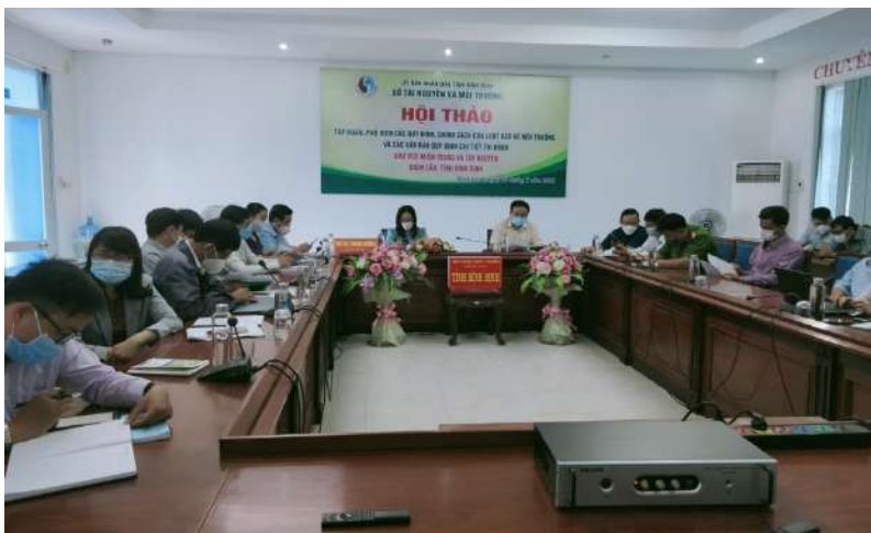
Đại biểu tham dự tại điểm cầu tỉnh Bình Định

Luật Bảo vệ môi trường số 72/2020/QH14 được Quốc hội ban hành ngày 17/11/2020 có hiệu lực thi hành kể từ ngày 10/01/2022 có rất nhiều điểm mới, liên quan đến nhiều lĩnh vực, nhiều luật khác nhau và thay đổi căn bản so với các quy định hiện hành. Tại Hội thảo các đại biểu đã được nghe tập trung vào 05 chuyên đề