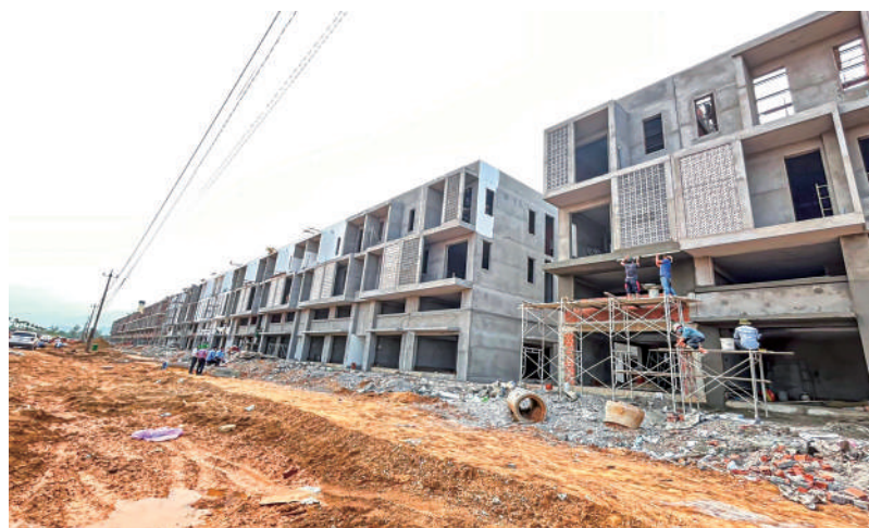
Công trường xây dựng Khu nhà ở công nhân

Hiện nay, Cty CP Becamex Bình Định đang hỗ trợ 03 dự án (trong đó có Tập đoàn Kurz) hoàn tất các thủ tục cần thiết để khởi công xây dựng Nhà máy sản xuất nhũ và màng mỏng công nghệ cao trong quý II/2022, đồng thời tiếp tục phối hợp với các ngành chức năng đẩy mạnh công tác quảng bá, xúc tiến thu hút thêm nhiều nhà đầu tư lớn, sử dụng công nghệ tiên tiến đến đầu tư tại KCN Becamex Bình Định trong thời gian đến. □