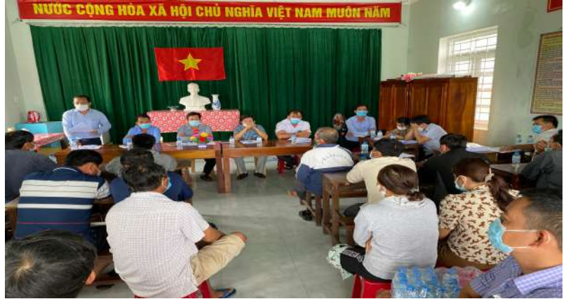
BQL KKT chủ trì buổi họp dân triển khai công tác giải phóng mặt bằng

Năm 2021, do ảnh hưởng đại dịch Covid-19 tiếp tục diễn biến phức tạp trên phạm vi cả nước, đã làm ảnh hưởng trực tiếp đến việc triển khai nhiệm vụ bồi thường, GPMB tại Khu kinh tế Nhơn Hội nói chung. Trong thời gian gián đoạn này, BQL KKT đã tham mưu xây dựng và trình UBND tỉnh ban hành chính sách đặc thù về bồi thường, hỗ trợ và TĐC khi nhà nước thu hồi đất trên địa bàn thôn Vĩnh Hội ( Quyết định số 41/2021/QĐ-UBND ngày 29/7/2021 ), để giải quyết những khó khăn của người dân bị ảnh hưởng do dự án chậm triển khai kéo dài nhiều năm, đảm bảo chấp hành đúng các chính sách hiện hành của nhà nước, tạo điều kiện cho nhà đầu tư sớm triển khai xây dựng tại hiện trường. Đồng thời, ngày 31/3/2021 Trưởng Ban BQL KKT đã phê duyệt dự án đầu tư xây dựng dự án Khu dân cư và TĐC Vĩnh Hội, khẩn trương