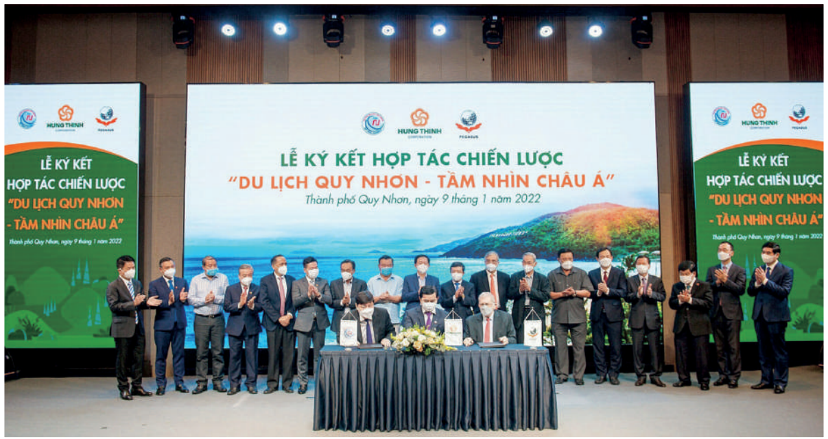
Lãnh đạo Trung ương và Lãnh đạo tỉnh chứng kiến Lễ ký kết hợp tác chiến lược “Du lịch Quy Nhơn - Tầm nhìn châu Á” giữa Tập đoàn Hưng Thịnh, Tập đoàn Tư vấn Quốc tế Boston Consulting Group (BCG) và Vietravel