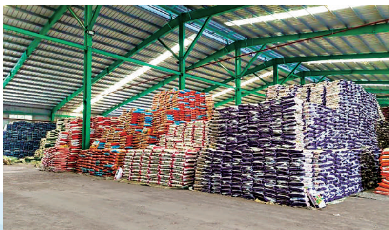
Một góc hoạt động sản xuất của Nhà máy sản xuất phân bón NPK

Năm 2021, ứng phó với đại dịch COVID-19, nhất là đợt dịch lần thứ 4 bùng phát nhanh và ngày càng nguy hiểm, đã ảnh hưởng nặng nề đến hoạt động sản xuất của DN cả nước nói chung và DN trong tỉnh nói riêng. Công ty đã triển khai áp dụng nhiều sáng kiến để khắc phục những tác động tiêu cực của dịch bệnh như: Áp dụng giờ làm linh hoạt; cắt giảm chi phí sản xuất; rà soát, tìm kiếm nguồn cung ứng nguyên vật liệu thay thế; tích cực tìm kiếm thị trường tiêu thụ sản phẩm, đặc biệt là khai thác thị trường nội địa, ứng dụng công nghệ chuyển đổi số, nhanh nhạy nắm bắt cơ hội kinh doanh mới; ứng dụng công nghệ trong sản xuất kinh doanh để đảm bảo hoạt động sản xuất duy trì một cách bền vững... trong năm, DN đã chi 05 tỷ đồng