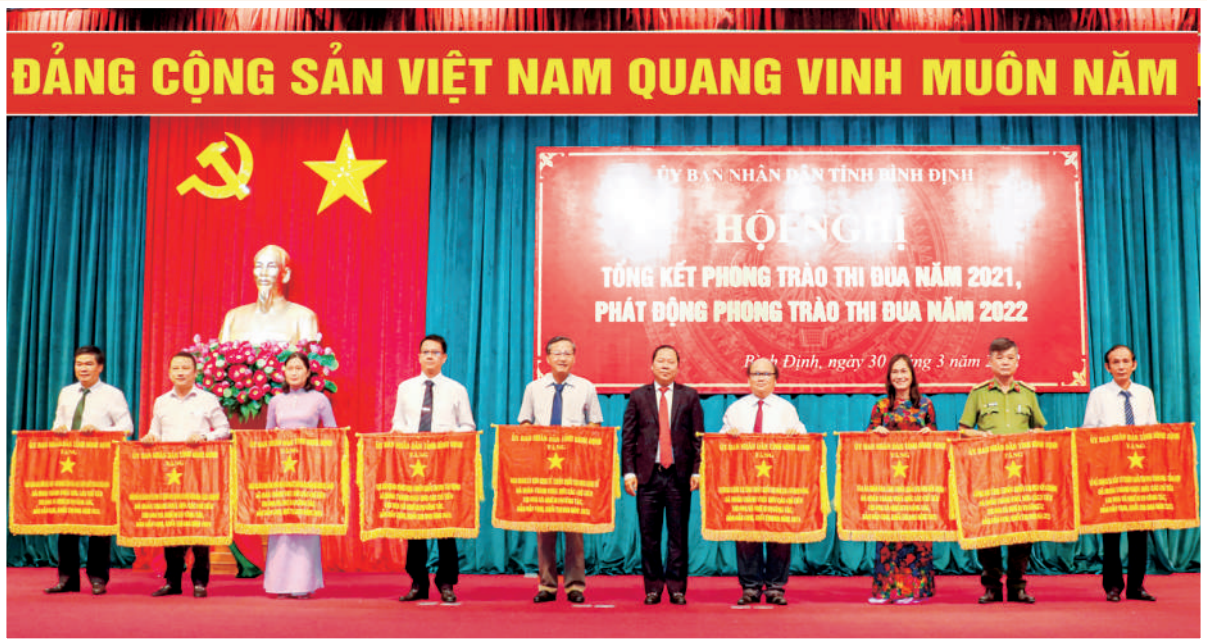
Lãnh đạo Ban Quản lý Khu kinh tế nhận Cờ thi đua của Chủ tịch UBND tỉnh dẫn đầu Khối thi đua kinh tế năm 2021