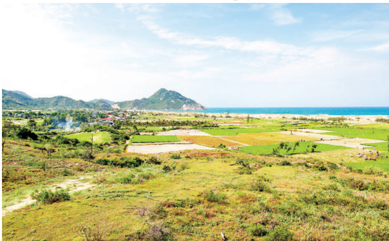
Một góc hiện trạng dự án