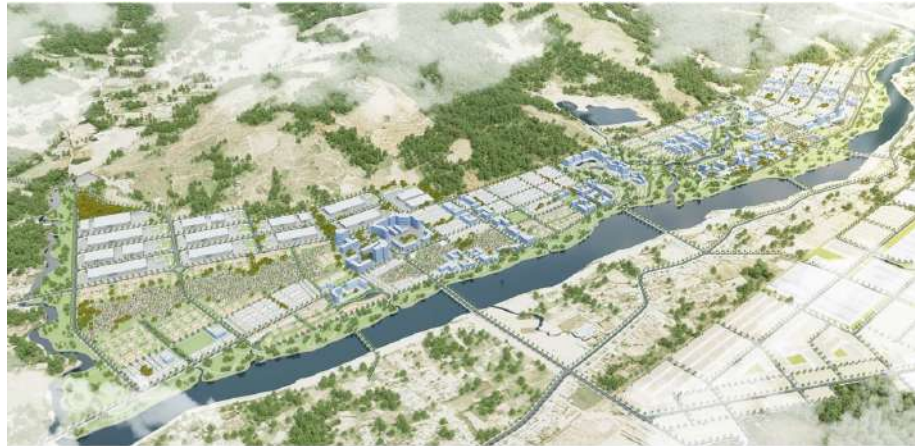
Phối cảnh tổng thể Phân khu 8

Thời gian qua, BQL KKT đã tổ chức triển khai lập đồ án quy hoạch theo nhiệm vụ quy hoạch được duyệt (QĐ số 1001/QĐ-UBND ngày 24/3/2021), đồng thời cập nhật thêm một số nội dung từ đồ án quy hoạch vùng huyện Vân Canh đã phê duyệt, quy hoạch PK8 sẽ cập nhật quy hoạch Cụm logistics số 2 (cụm phía Tây Nam tỉnh), với quy mô khoảng 150 ha, tuy nhiên về