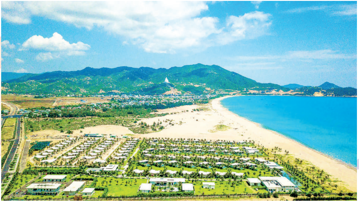
Một góc KKT Nhơn Hội