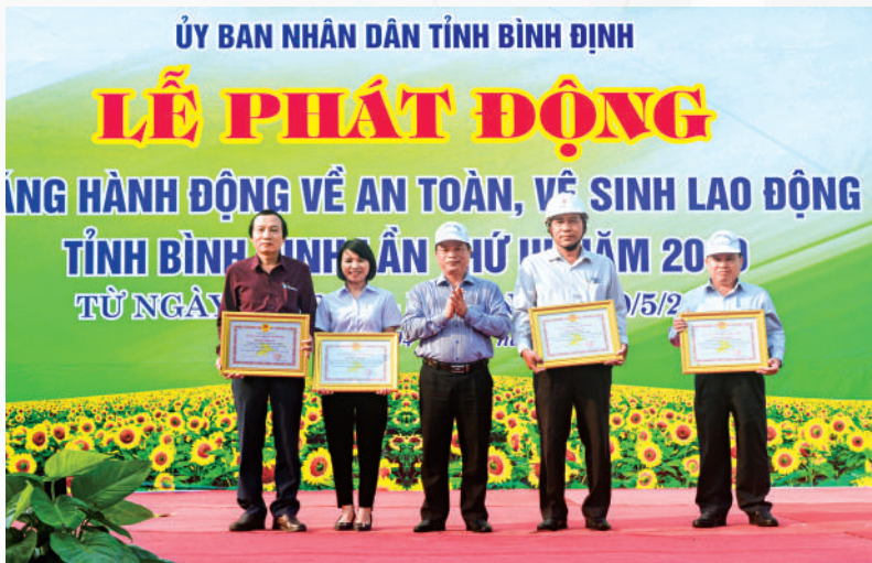
Lãnh đạo tỉnh Bình Định tặng Bằng khen cho các doanh nghiệp trên địa bàn tỉnh đạt thành tích xuất sắc trong công tác an toàn, vệ sinh lao động

- Phần lớn các DN đang hoạt động trong KKT, KCN chủ yếu là các DN vừa và