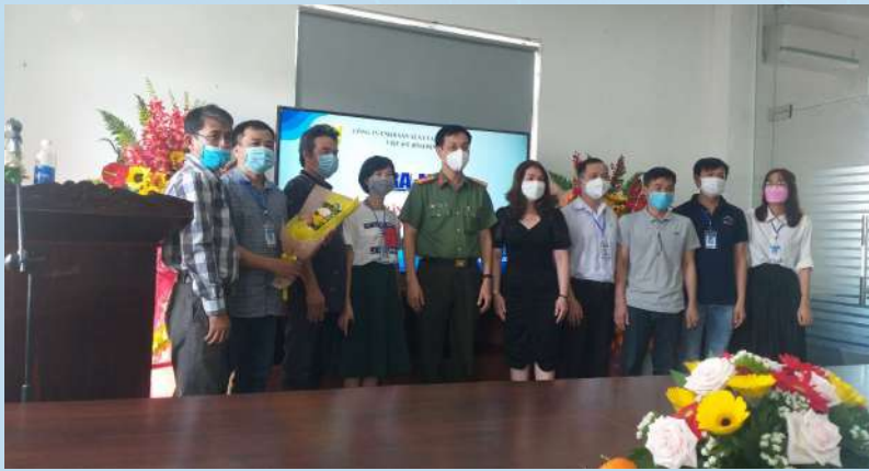
Lễ ra mắt mô hình “Tổ công nhân tự quản về An ninh trật tự và phòng, chống dịch COVID-19” của Công ty TNHH Thương mại và Sản xuất Việt Mỹ (KCN Long Mỹ)

chính sách cho NLĐ và hoạt động của các DN tốt hơn. Ngoài ra, thông qua các kỳ sinh hoạt chi bộ, công đoàn, đã kịp thời lồng ghép tuyên truyền, phổ biến chủ trương của Đảng, chính sách pháp luật của Nhà nước và các văn bản của cấp trên để giáo dục cho cán bộ, đảng viên nâng cao ý thức giữ vững đoàn kết nội bộ, đề cao tinh thần cảnh giác cách mạng, bảo vệ chủ quyền quốc gia, thực hiện nghiêm đường lối, chủ trương chính sách pháp luật Nhà nước; thực hiện đầy đủ quyền và nghĩa vụ của cán bộ công chức theo quy định. Thông qua các buổi tập huấn cho Lãnh đạo DN, cán bộ làm công tác quản lý nhân sự và làm công tác công đoàn cập nhật thông tin pháp lý, tư vấn pháp luật cho DN trong các lĩnh vực có liên quan đến hoạt động của DN; đồng thời phối hợp, đề xuất xây dựng chuyên mục COVID-19