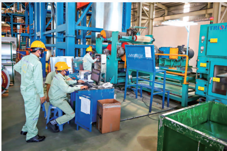
Công tác ATVSLĐ của người lao động tại Nhà máy Thép Hoa Sen Nhơn Hội

- Mặc dù có sự chỉ đạo của các Bộ, ngành Trung ương, Tỉnh ủy, UBND tỉnh về công tác ATVSLĐ nhưng ở một số DN vẫn chưa chú trọng công tác này, sau thời gian diễn ra Tháng hành động về ATVSLĐ năm 2021 không thường xuyên, liên tục tuyên truyền, hướng dẫn