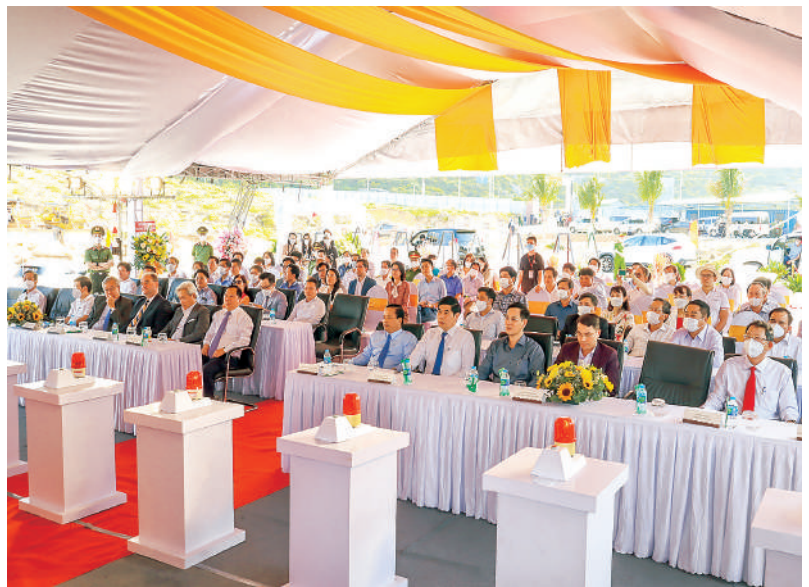
Quang cảnh buổi lễ