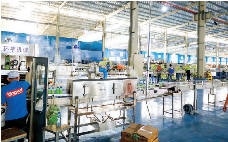
Hoạt động SXKD của Nhà máy sản xuất nước giải khát Tingco Bình Định, KKT Nhơn Hội

nguyên liệu gỗ nhập khẩu thì hiện nay đã tăng từ 3 - 5 USD/m 3 do khó khăn về logistics, container và tàu biển vận chuyển. Hiện các DN vẫn phải tiếp tục mua nguyên liệu vì là trong mùa khai thác của các nước xuất khẩu gỗ như Uruguay, Brazil... Nếu các DN không chuẩn bị kịp thì sẽ thiếu hụt nguyên liệu gỗ khi khách hàng bắt đầu giao đơn hàng mới.