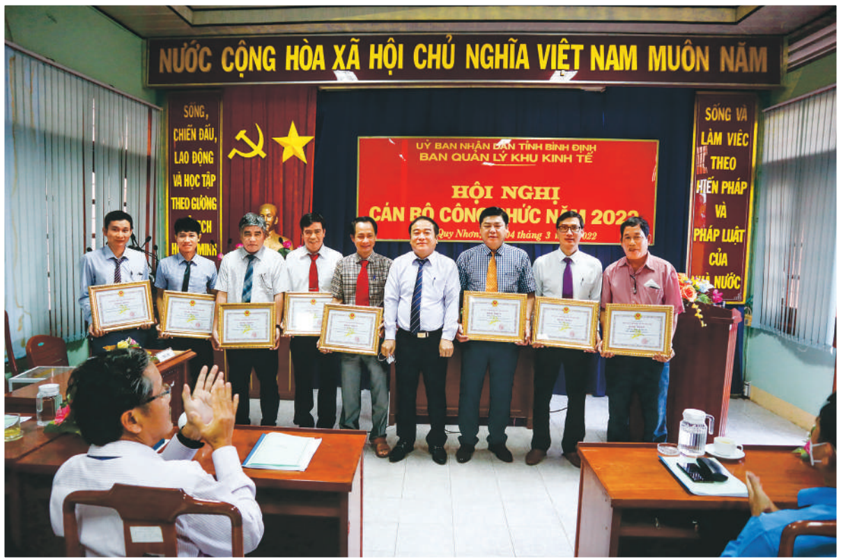
Lãnh đạo Ban Quản lý KKT trao Bằng khen của Chủ tịch UBND tỉnh cho công chức, viên chức, người lao động tại Hội nghị CBCC năm 2022