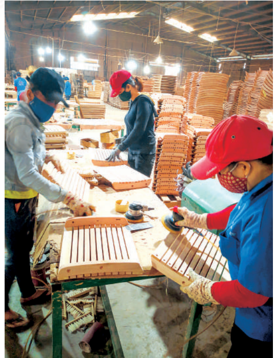
Hoạt động chế biến gỗ của Công ty TNHH Hoàng Hưng KCN Phú Tài

Xuất nhập khẩu hàng hóa trong quý I/2022 gặp nhiều khó khăn: giá nhiên liệu tăng, thiếu container, chi phí vận chuyển tăng. Bên cạnh đó tình hình chiến sự Nga - Ukraine buộc các DN phải tạm dừng giao dịch với Nga và chuyển sang tìm nhà cung ứng từ các nơi khác như Úc, Nam Mỹ, Nam Phi. Quan