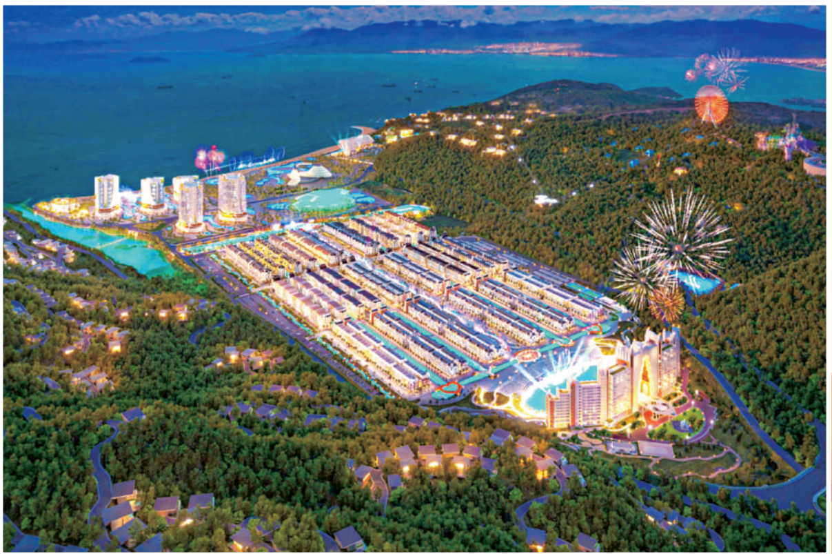
Dự án Hải Giang Merry Land Quy Nhơn tại KKT Nhơn Hội