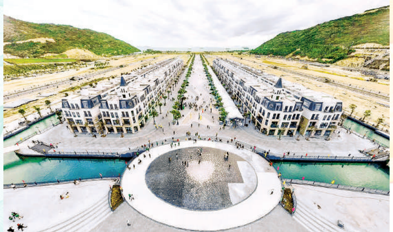
Dự án Hải Giang Merry Land Quy Nhơn do tập đoàn Hưng Thịnh đầu tư đang được đẩy nhanh tốc độ triển khai

Đối chiếu với kinh nghiệm của các tỉnh bạn, trong điều kiện hiện nay Bình Định hoàn toàn có đáp ứng tốt các yêu cầu nêu trên. Với quỹ đất đã có kết cấu hạ tầng tại các KCN Bình