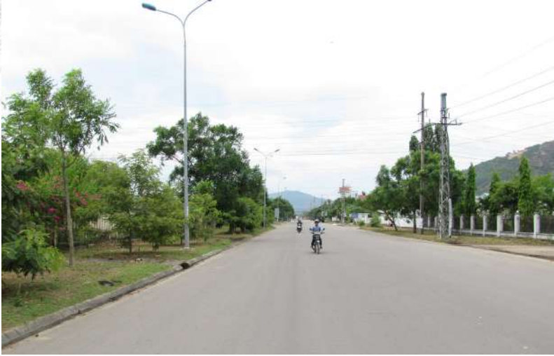
Một góc hạ tầng của KCN Long Mỹ

và sửa chữa các tuyến mương (đường số 14, 16 và phía Nam Cty Trường Huy); thi công tuyến thoát nước mưa, nhằm xử lý việc thoát nước mưa cuốn theo đất đá trên núi Hòn Chà tràn qua đường số 15 chảy vào mặt bằng của Cty Giày; trong quý III/2022: Nhằm tránh tình trạng nước mưa thoát không kịp tràn vào mặt bằng của các Doanh nghiệp (đoạn từ Cty VQN đến Cty Thiên Bắc), Công ty tiến hành khảo sát đánh giá hiện trạng làm cơ sở để sửa chữa hoặc nâng cấp mở rộng tuyến mương hở thoát nước đoạn từ Cty Đại Hùng đến Cty Tân Trung Nam.