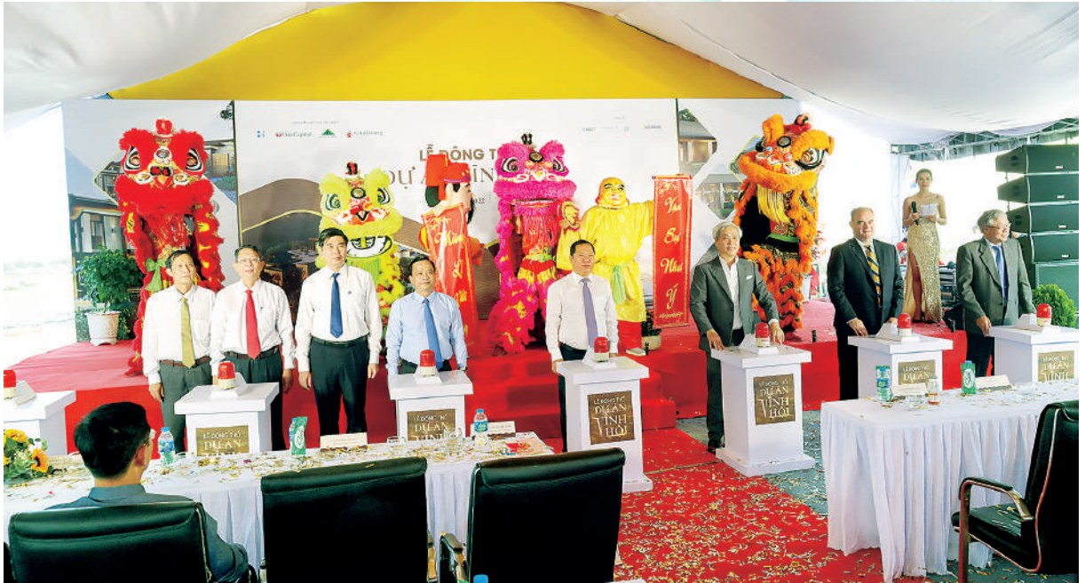
Lãnh đạo tỉnh và Nhà đầu tư chụp ảnh lưu niệm tại buổi lễ

N gày 19/4/2022, tại xã Cát Hải - huyện Phù Cát, Công ty CP Du lịch và Khách sạn Việt - Mỹ đã tổ chức Lễ động thổ Dự án Khu du lịch Khách sạn nghỉ dưỡng Vĩnh Hội. Đến tham dự Lễ có các đồng chí Lãnh đạo tỉnh, Lãnh đạo huyện Phù Cát và Lãnh đạo xã Cát Hải.