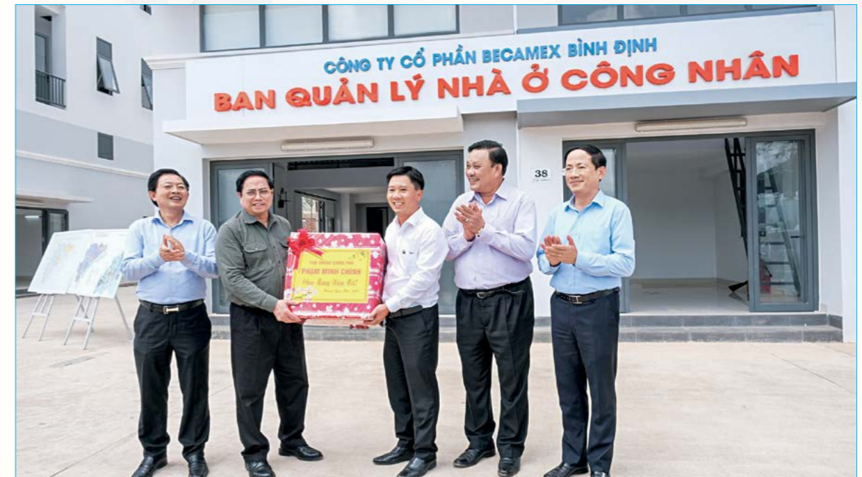
Đoàn công tác của Chính phủ do đồng chí Phạm Minh Chính - Ủy viên Bộ Chính trị, Thủ tướng Chính phủ dẫn đầu đến thăm Khu công nghiệp Becamex VSIP Bình Định thuộc phân khu 7 Khu kinh tế Nhơn Hội, tại xã Canh Vinh,

Khu kinh tế được tăng lên thành 14.308 ha. Tại thời điểm điều chỉnh, đã thu hút đầu tư vào KKT được 83 dự án, với tổng vốn đầu tư đăng ký khoảng 73.156 tỷ đồng, vốn đầu tư thực hiện đạt khoảng 18.890 tỷ đồng (chiếm 25,8% tổng vốn đăng ký), trong đó, 14 dự án có vốn đầu tư trực tiếp nước ngoài với tổng vốn đăng ký đầu tư 355 triệu USD.