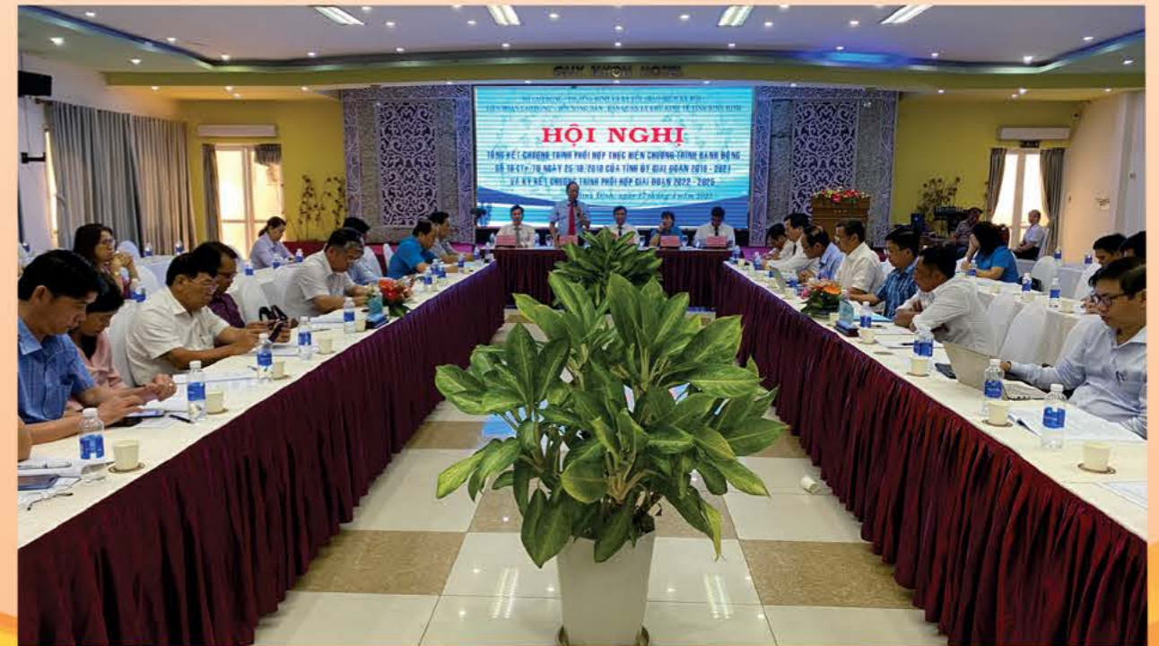
Hội nghị Tổng kết Chương trình phối hợp giữa Sở Lao động - Thương binh và Xã hội và Bảo hiểm xã hội tỉnh, Liên đoàn Lao động tỉnh, Hội Nông dân tỉnh, Ban Quản lý Khu kinh tế tỉnh giai đoạn 2019 - 2021