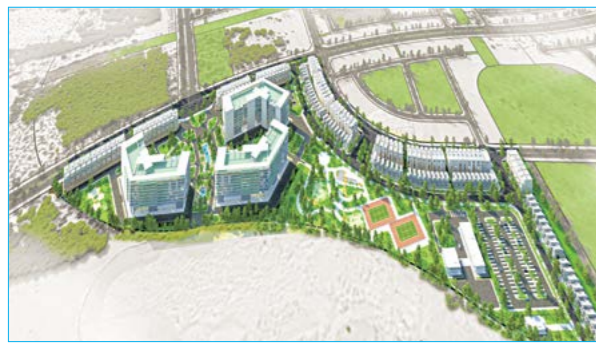
QHCT dự án NOXH tại PK5

Việc triển khai lập đồ án quy hoạch chi tiết xây dựng tỷ lệ 1/500 đối với 02 dự án nhà ở xã hội nêu trên nhằm cụ thể hóa đồ án quy hoạch chi tiết xây dựng tỷ lệ 1/500 Khu đô thị du lịch sinh thái Nhơn Hội đã được UBND tỉnh phê duyệt; cũng như làm cơ sở để tổ chức lựa chọn Nhà đầu tư triển khai dự án; Góp phần hoàn thành kế hoạch phát triển nhà ở xã hội trên địa bàn tỉnh Bình Định, đáp ứng nhu cầu nhà ở xã hội cho các đối tượng có đủ điều kiện được hưởng chính sách nhà ở xã hội theo quy định. □