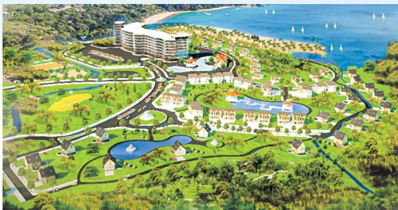
Phối cảnh khu du lịch sinh thái nghỉ dưỡng Tân Thanh

Ngày 16/3/2023, Ban Quản lý dự án và Giải phóng mặt bằng KKT phối hợp với UBND và UBNDTTQ Việt Nam xã Cát Hải, đã mời các hộ dân bị ảnh hưởng giải