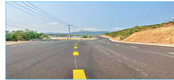
Tuyến đường Nhơn Hội - Nhơn Hải (đoạn từ KDL Hải Giang đến nút giao N1)

Đ ể tạo thuận lợi cho việc thông thương giữa xã Nhơn Hải với các khu vực lân cận trong Khu kinh tế, thúc đẩy phát triển kinh tế - xã hội, dịch vụ du lịch của tỉnh. Trong năm 2022, UBND tỉnh đã giao Ban Quản lý Khu kinh tế làm chủ đầu tư, tổ chức thi công sửa chữa, nâng cấp tuyến đường Nhơn Hội - Nhơn Hải, cụ thể gồm 2 gói thầu: