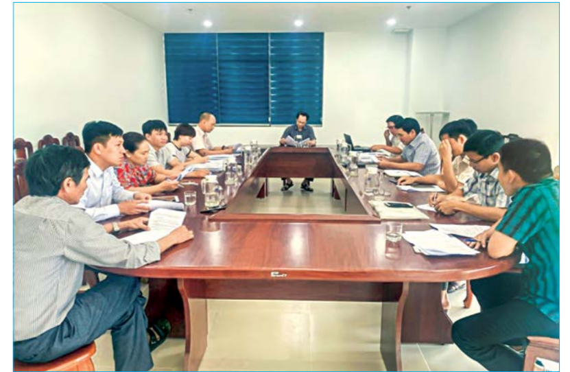
Họp Tổ công tác thông qua phương án bồi thường các dự án trọng điểm trong KKT

Song song với nhiệm vụ phối hợp cùng địa phương, nhiệm vụ cũng cố hoàn thành hồ sơ và tổ chức cuộc họp Tổ công tác cùng với các cơ quan liên quan để hoàn thiện phương án bồi thường GPMB, báo