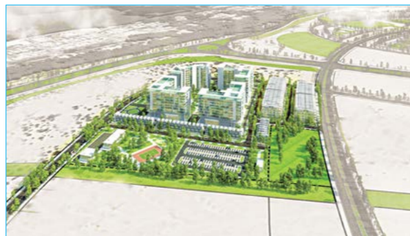
QHCT dự án NOXH tại PK8