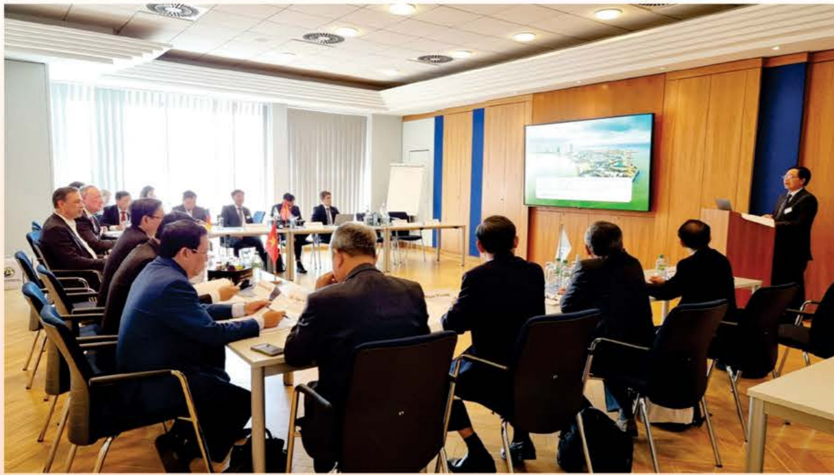
Đoàn công tác xúc tiến đầu tư của tỉnh do đồng chí Hồ Quốc Dũng - Ủy viên Trung ương Đảng, Bí thư Tỉnh ủy dẫn đầu làm việc với Tập đoàn PNE tại Cuxhaven, CHLB Đức