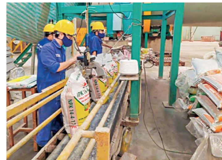
Hoạt động SXKD của Công ty CP Vật tư nông nghiệp

Xuất nhập khẩu hàng hóa trong quý I/2023 gặp nhiều khó khăn. Giá nhiên liệu tăng, đồng thời thiếu container, chi phí vận chuyển tăng. Bên cạnh đó tình hình chiến sự Nga - Ukraine buộc các DN phải tạm dừng giao dịch với