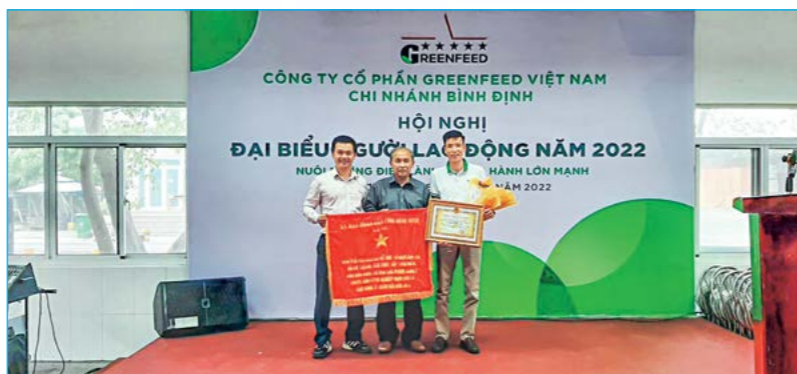
Lãnh đạo Công ty CP Greenfeed Việt Nam Chi nhánh Bình Định nhận Cờ thi đua và Bằng khen của UBND tỉnh

Định kỳ hàng năm, Ban lãnh đạo Công ty phối hợp với Công đoàn cơ sở tổ chức tốt Hội nghị Người lao động (NLD), nhằm đánh giá những kết quả đạt được trong năm qua và đề ra kế hoạch, phương hướng, giải pháp thực hiện kế hoạch năm tới. Do vậy, mặc dù năm 2022 tình hình kinh tế còn nhiều biến động, khó khăn, ảnh hưởng đến hoạt