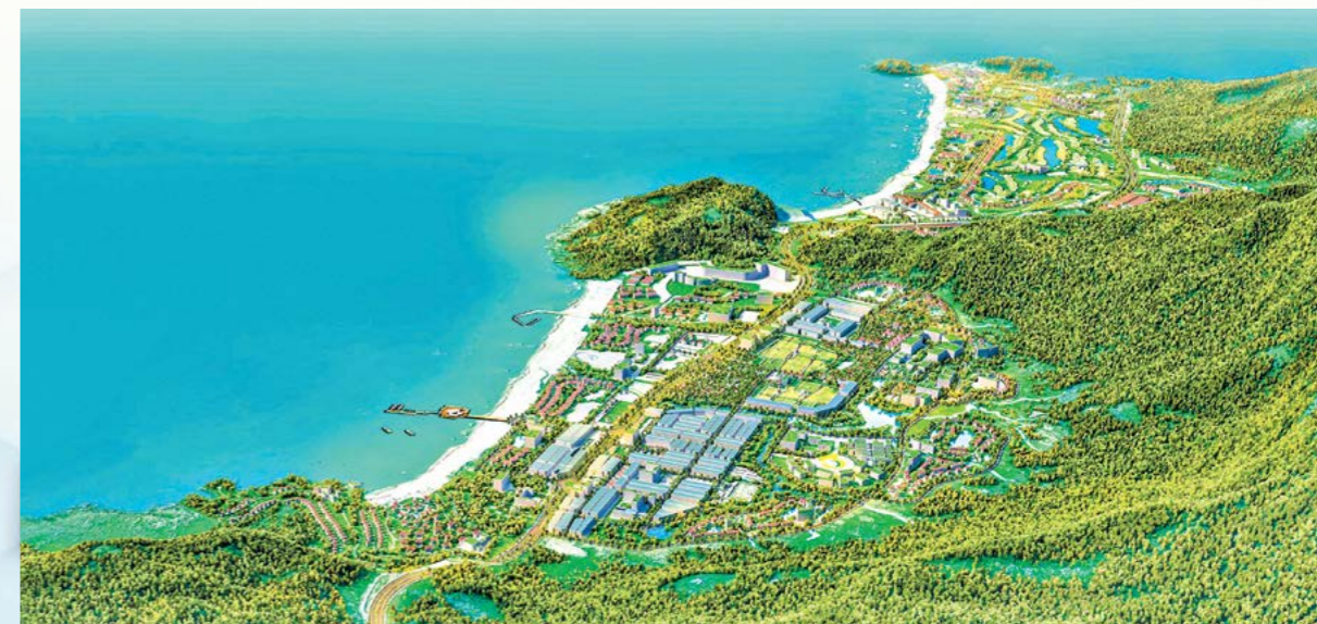
Phối cảnh quy hoạch Khu đô thị, du lịch Tân Thanh, Vĩnh Hội (phân khu 1), KKT Nhơn Hội

có tiềm năng phát triển nhất, có vị trí nằm tại trung tâm KKT, có điều kiện tự nhiên phong phú, thuận lợi để phát triển nhanh. Thực tế những năm gần đây, tại phân khu này cũng có nhiều dự án đầu tư khá lớn, hiệu quả tạo nên bộ mặt mới cho KKT, dần hình thành KKT theo hướng phát triển năng động, hiện đại. Điển hình là Quần thể du lịch sinh thái và thể thao FLC (450 ha), các dự án du lịch Eo gió, kỳ Co, ALLia... đang là khởi điểm, động lực phát triển của phân khu 3. Đặc biệt, Khu dân cư hiện trạng Nhơn Phước và Nhơn Lý đã và đang được xây dựng mới, chỉnh trang ngày càng khang trang, KĐT DLST Nhơn Hội (600 ha) đã có 300 ha được xây dựng đầy đủ, đồng bộ hạ tầng đô thị (các khu ở, thể thao, điểm vui chơi giải trí...), sẵn sàng đón nhận hàng chục ngàn cư dân đến sinh sống và làm việc. Tại phân khu này, dự kiến thời gian đến, các nhà đầu tư tiếp tục đầu tư mở rộng, nâng cấp và bổ sung thêm nhiều tính năng mới (căn hộ cao cấp cao tầng, nhà ở xã hội, trường học, bệnh viện, phim trường, phố đêm, sân vận động, khu liên hiệp thể thao, Trung tâm hành chính tỉnh Bình Định...) sẽ tạo nên bước phát triển mới đồng bộ, hoàn chỉnh phân khu 3.