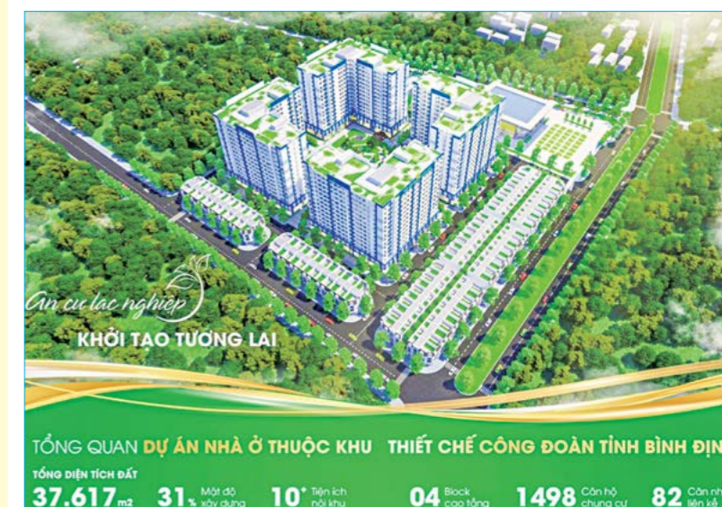
Phối cảnh tổng quan và thông tin dự án.

Trước thực trạng đó, năm 2018, Tại Đại hội lần thứ XIII Công đoàn Bình Định, Tổng LĐLĐ Việt Nam đã