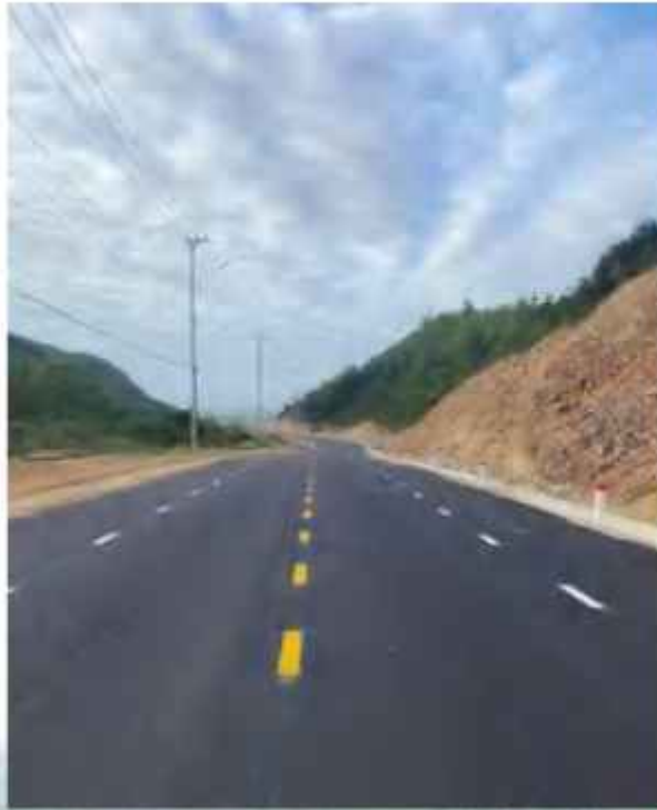
Tuyến đường kết nối từ xã Nhơn Hội đi xã Nhơn Hải

có tổng chiều dài khoảng 6 km, với mặt cắt ngang 13m, trước đây tuyến đường đi qua địa hình đồi núi có độ dốc tự nhiên tương đối lớn và mặt cắt ngang đường rất hẹp khi tham gia giao thông trên tuyến đường này rất nguy hiểm. Theo đó, hệ thống chiếu sáng cũng được đầu tư mới trải dài dọc trên tuyến đường để đáp ứng nhu cầu đi lại nhân dân trong vùng, đặc biệt kết nối thông suốt hạ tầng kỹ thuật của khu vực và phục vụ cho các dự án đầu tư du lịch trên địa bàn xã Nhơn Hải và Nhơn Hội và góp phần từng bước hoàn thiện kết cấu hạ tầng giao thông đồng bộ.