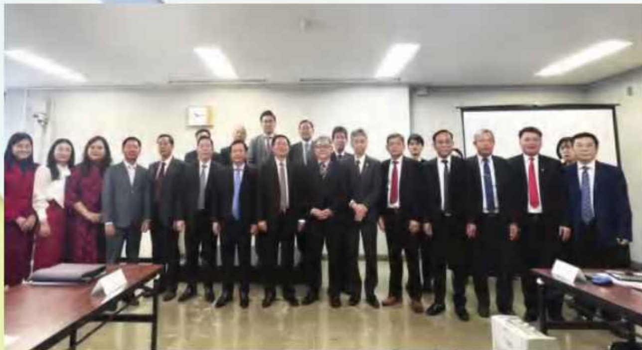
Đoàn công tác tỉnh Bình Định do đồng chí Hồ Quốc Dũng - Ủy viên BCH Trung ương Đảng, Bí thư Tỉnh ủy, Chủ tịch HĐND tỉnh làm Trưởng đoàn đã có buổi làm việc với Cục kinh tế, thương mại và công nghiệp Kansai (Meti Kansai) trong chuyến XTĐT tại Nhật Bản