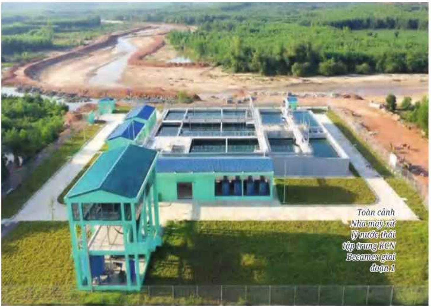
Toàn cảnh Nhà máy xử lý nước thải tập trung KCN Becamex giai đoạn 1

- Hoàn thành 28,11 km/43,54 km tuyến thoát nước mưa, nước thải (đạt 64,6%), riêng tuyến ống thu gom nước thải từ mặt bằng các dự án thứ cấp đã thu hút đầu tư đến nhà máy xử lý nước thải tập trung đã hoàn thành 100%.