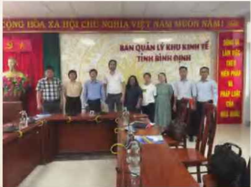
Đoàn công tác của Công ty VidaXL Group B.V làm việc với lãnh đạo Ban Quản lý KKT

Công ty VidaXL Group B.V là một doanh nghiệp bán lẻ trực tuyến có nguồn gốc từ Hà Lan, nổi tiếng với việc phân phối các sản phẩm thông qua cửa hàng trực tuyến của mình và trên các nền tảng thương mại điện tử hàng đầu như Amazon, eBay và Bol.com. Với sứ mệnh mang đến những sản phẩm chất lượng và đa dạng cho khách hàng trên toàn thế giới, công ty đã xây dựng một tên tuổi vững chắc trong ngành bán lẻ trực tuyến. Hiện nay, sự phát triển của VidaXL không chỉ dừng lại ở việc mở rộng thị trường và phát triển sản phẩm, mà còn bao gồm việc đầu tư vào các nhà máy sản xuất, nhằm tối ưu hóa quy trình sản xuất và kiểm soát chất lượng sản phẩm. Điều này được thể hiện qua việc công ty đã đầu tư vào hai nhà máy sản xuất đồ nội thất tại Trung Quốc, tập trung vào việc chế biến gỗ thành ván (sợi) và sản xuất các sản phẩm từ gỗ nguyên khối. Các sản phẩm này được xuất khẩu sang các thị trường lớn