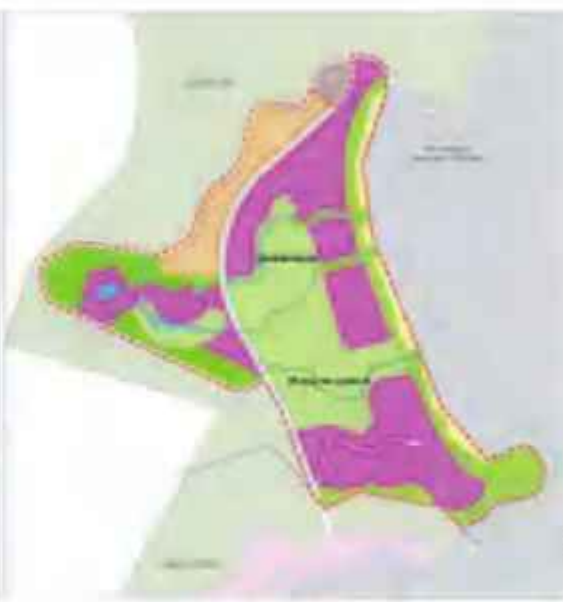
Đề xuất điều chỉnh

(Minh họa điều chỉnh Khu Đô thị, Du lịch Tân Thanh, Vĩnh Hội - Phân khu 01)