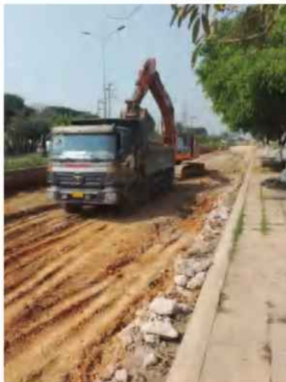
Công tác duy tu sửa chữa Trục đường chính KCN

Với quyết tâm đồng hành cùng địa phương trong công cuộc phát triển kinh tế, thu hút đầu tư, thời gian tới, CĐT KCN Nhơn Hòa sẽ tiếp tục chú trọng và đẩy mạnh đầu tư hoàn thiện cơ sở hạ tầng và công trình phụ trợ để phục vụ các nhà đầu tư thứ cấp. Bên cạnh đó, chủ động gia tăng năng lực cạnh tranh thông qua nâng cao chất lượng các sản phẩm - dịch vụ cung ứng; tiếp tục tổ chức các chương trình xúc tiến đầu tư đến các tập đoàn lớn, nhà đầu tư trong và ngoài nước; phối hợp với các cơ quan, ban ngành nhằm tạo mọi điều kiện thuận lợi nhất để giúp nhà đầu tư sớm triển khai dự án.