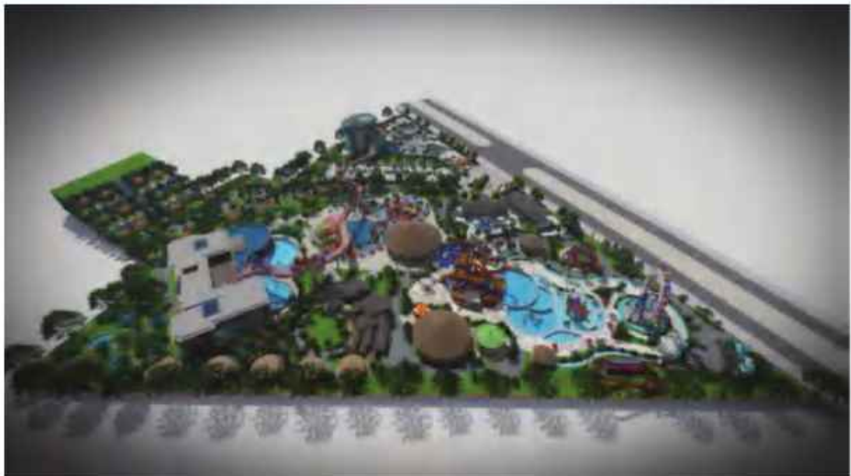
Khu vui chơi Phú Hậu - Cát Tiến, Khu kinh tế Nhơn Hội

Trên tinh thần chỉ đạo của UBND tỉnh, Ban Quản lý Khu kinh tế đã khẩn trương phối hợp với UBND huyện Phù Cát và UBND thị trấn Cát Tiến xây dựng Kế hoạch và hoàn thiện công tác xác nhận nguồn gốc đất đối với 45 hộ bị ảnh hưởng còn lại