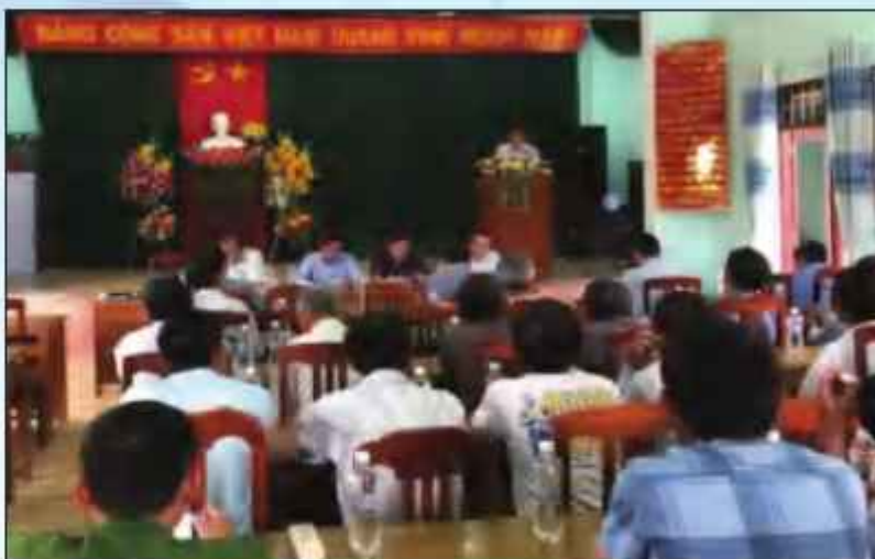
Tổ chức họp dân để triển khai công tác GPMB một số dự án trong KKT Nhơn Hội

Việc xác định tỷ lệ tăng giá bán của phương pháp thặng dư đã gặp vướng mắc khi áp dụng Nghị định số 44/2014/NĐ-CP, Thông tư số 36/2014/TT-BTNMT. Khi xây dựng dự thảo Nghị định sửa đổi, có đề cập dự thảo nhưng khi ban hành chính thức Nghị định số 12/2024/NĐ-CP thì không có quy định đối với yếu tố này.