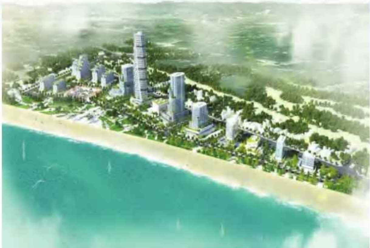
Quy hoạch 1/500 Khu khách sạn tại Điểm số 1 tuyến biển Nhơn Lý - Cát Tiến

Như vậy, với tinh thần chỉ đạo quyết liệt của Lãnh đạo Ban Quản lý Khu kinh tế và vào cuộc tích cực với chính quyền địa phương, đã kịp thời tháo gỡ những khó khăn, vướng mắc. Đến nay, đã cơ bản hoàn thành các Phương án bồi thường, GPMB đối với hai dự án trên địa bàn thị trấn Cát Tiến theo đúng tinh thần chỉ đạo của UBND tỉnh.