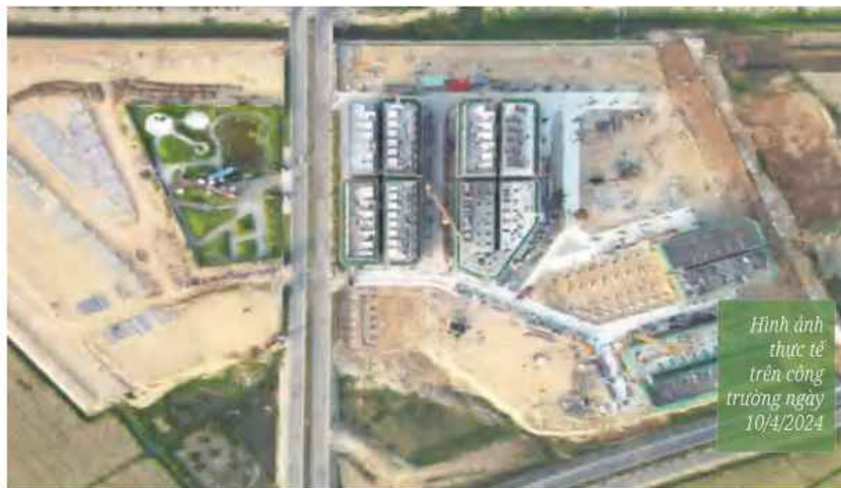
Hình ảnh thực tế trên công trường ngày 10/4/2024

Dự kiến sau khi hoàn thành, nơi đây hứa hẹn sẽ trở thành điểm đến hấp dẫn về kiến trúc và lý tưởng dành cho các hoạt động nghỉ dưỡng, du lịch và lễ hội, cũng như sinh hoạt cộng đồng đô thị về đêm, góp phần phát triển kinh tế xã hội cũng như thu hút đầu tư vào địa phương.