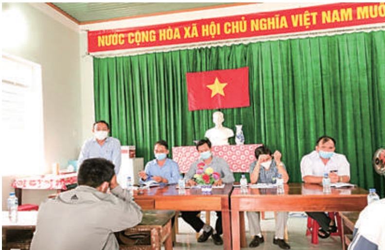
Lãnh đạo BQL KKT, UBND huyện Phù Cát, Đảng Ủy - UBND xã Cát Hải tham gia vận động người dân tại thôn Vĩnh Hội.

Với những kết quả bước đầu đạt được như đã nêu, dự kiến năm 2023, sau khi cơ bản hoàn thành xây dựng khu tái định cư Vĩnh Hội và giai đoạn 1 của KDL Vĩnh Hội, công tác giải phóng mặt bằng phần diện tích còn lại của dự án (136 ha) sẽ tiếp tục triển khai vào cuối quý 2/2023, để sớm giao mặt bằng sạch cho nhà đầu tư xây dựng hoàn thành toàn bộ dự án (231 ha), đưa khu du lịch đi vào hoạt động trong giai đoạn phát triển 2026 - 2030. □