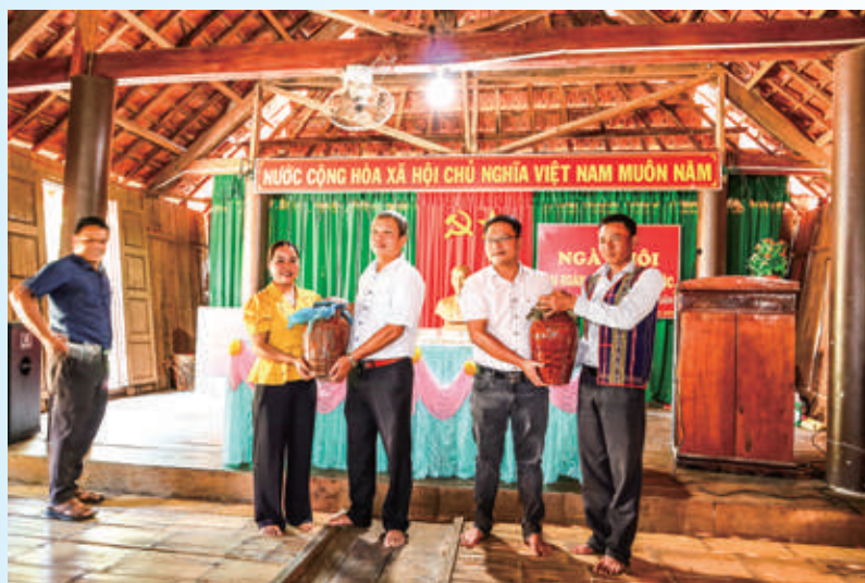
LĐ BQL KKT thăm và tặng quà cho đơn vị kết nghĩa tại Làng 2, xã Vĩnh Thuận, huyện Vĩnh Thạnh

- Tiếp tục đổi mới và nâng cao chất lượng, hiệu quả công tác giáo dục, chính trị tư tưởng với nhiều hình thức phong phú, phù hợp với tình hình thực tế. Phối hợp với Chính quyền ban hành và tổ chức tuyên truyền, phổ biến giáo dục pháp luật, tập trung tuyên truyền về cải cách hành chính, phòng chống tham nhũng, lãng phí, ứng dụng CNTT phát triển chính quyền số và các dịch vụ đô thị thông minh. Chú trọng công tác tuyên truyền trên các phương tiện thông tin đại chúng, với số lượng hơn