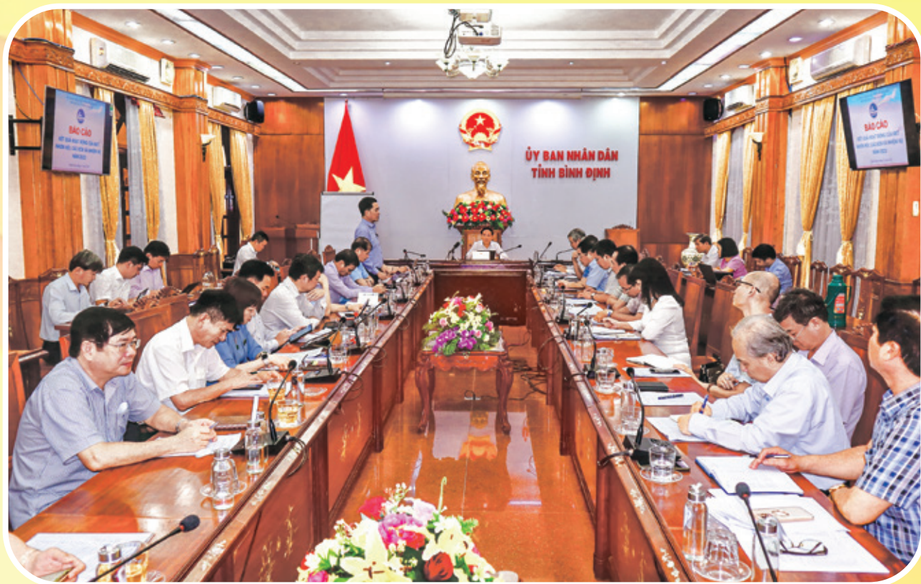
Chủ tịch UBND tỉnh và lãnh đạo một số Sở ngành làm việc với BQL KKT về kết quả hoạt động của KKT Nhơn Hội và các KCN trên địa bàn tỉnh