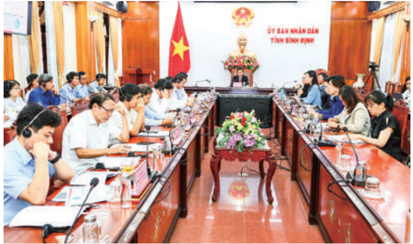
Hội thảo trực tuyến kết hợp trực tiếp xúc tiến đầu tư vào tỉnh Bình Định cho doanh nghiệp Đà Loan

Về cơ cấu nền kinh tế, tốc độ tăng trưởng và tỷ trọng của nhóm ngành Nông Lâm nghiệp, và Thủy hải sản có xu hướng ngày càng giảm, nhưng tổng giá trị sản phẩm và chất lượng tăng trưởng ngày càng được cải thiện nâng cao, qua các giai đoạn phát triển. Tương tự như vậy, nhóm ngành dịch vụ tiếp tục tăng trưởng, nhưng tốc độ và tỷ trọng trong nền kinh tế cũng giảm dần, tổng giá trị sản phẩm và chất lượng