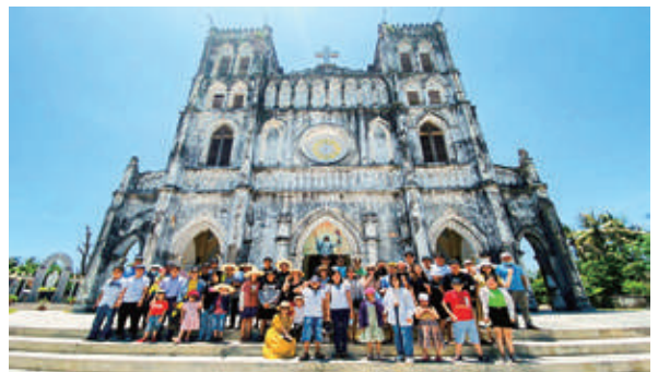
Toàn thể gia đình viên chức người lao động Ban QLDA&GPMB chụp ảnh lưu niệm trong đợt tham quan năm 2022

Triển khai phong trào thi đua xây dựng “ Xanh - sạch - Đẹp, bảo đảm ATVSLĐ ”, CĐBP đã phối hợp với Chi đoàn TNCS HCM phát động và tổ chức trồng cây xanh trong khuôn viên Nhà máy Xử lý nước thải KCN Nhơn Hội.