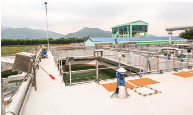
Hệ thống xử lý nước thải tập trung với công suất xử lý đạt 4.000m 3 ngày đêm đã xây dựng hoàn thành

- KCN Nhơn Hội do BQL KKT làm chủ đầu tư, hiện nay đã xây dựng hoàn thành hệ thống XLNT tập trung với công suất xử lý đạt 2.000 m 3 /ngày đêm. Nước thải sau xử