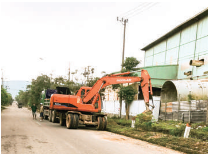
Nạo vét tuyến mương hồ tại đường 19, KCN Phú Tài

- Công tác duy tu bảo dưỡng các hạng mục hạ tầng kỹ thuật của 02 KCN: sửa chữa các đoạn đường hư hỏng ở phía trước công ty VTNN Bình Định và Công ty Cargill; trên Đường trục trung tâm, Đường số 15 (đoạn Công ty Khải Hoàn đến Công ty Hoàng Long KCN Phú Tài); nâng cấp sửa chữa đoạn tiếp giáp giữa Quốc lộ 1A và tuyến đường số 19; Phát quang và nạo vét Đoạn mương phía Nam Công ty Đức Hải và các đoạn mương chuyển tiếp đầu nối vào Công thoát nước Quốc lộ như: đoạn đầu tuyến đường 19, Tuyến mương phía Nam Công ty Phú Hiệp, Tuyến mương phía Nam và phía Bắc Công ty CPPC và khu vực chuyển tiếp phía Đông Công ty Green Ceramic; Nạo vét và gia cố hành lang thoát nước mưa tại phía Đông Nam mặt bằng Công ty Huỳnh Phát nhằm đảm bảo việc thoát nước mưa cho cả khu vực; Phát quang, nạo vét và sửa chữa các tuyến mương đường số 14, đường số 16