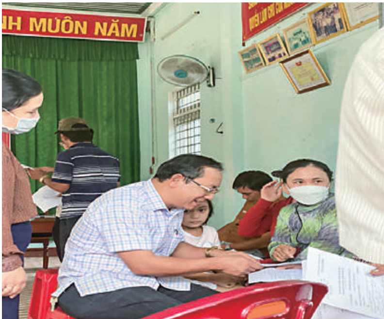
Tổ trưởng tổ công tác công bố Phương án bồi thường Đợt 2 - Khu vui chơi Phú Hậu

Với những nỗ lực của toàn thể Hội đồng bồi thường, tổ công tác bước đầu đã đạt được kết quả đáng khích lệ, qua đó sẽ tạo tiền đề cho việc triển khai đầu tư Khu vui chơi đẳng cấp đầu tư của Khu kinh tế Nhơn Hội trong năm 2023. □