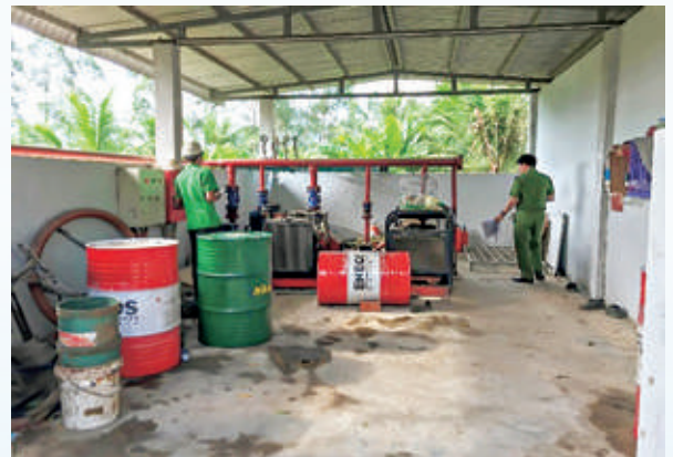
Kiểm tra thiết bị PCCC tại cơ sở