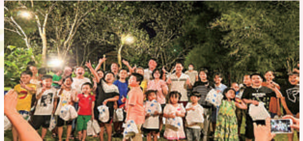
LĐ Ban QLDA&GPMB tặng quà các em thiếu nhi trong đợt tham quan tháng 5/2022

Triển khai phong trào thi đua xây dựng “ Xanh - sạch - Đẹp, bảo đảm ATVSLĐ ”, CĐBP đã phối hợp với Chi đoàn TNCS HCM phát động và tổ chức trồng cây xanh trong khuôn viên Nhà máy Xử lý nước thải KCN Nhơn Hội.