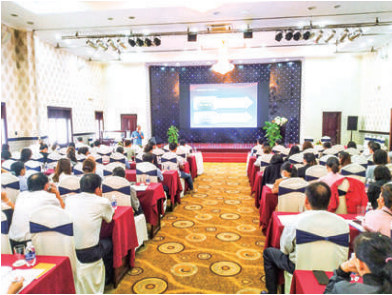
Hội nghị đối thoại, tuyên truyền, phổ biến pháp luật cho các doanh nghiệp trong Khu kinh tế, các khu công nghiệp năm 2022

DN trong việc rút ngắn thời gian thực hiện thủ tục pháp lý đầu tư.