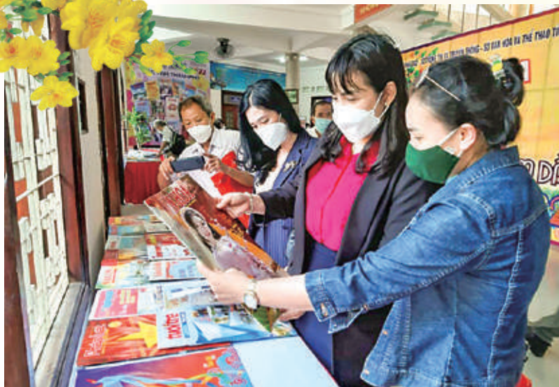
Bản tin Khu kinh tế hàng năm đều gửi tham gia tại Triển lãm Hội Báo Xuân của tỉnh

đạo công tác quản lý, chỉ đạo thực hiện nhiệm vụ của cơ quan; những thành tích, nét đẹp văn hóa xã hội, kết quả hoạt động sản xuất của các nhà đầu tư, DN trong KKT Nhơn Hội và các KCN; thông tin, phổ biến các văn bản qui phạm pháp luật, các văn bản chỉ đạo của các Bộ, ngành và UBND tỉnh.