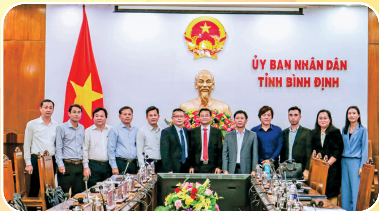
Hội thảo xúc tiến thu hút các doanh nghiệp Đài Loan đầu tư vào tỉnh Bình Định