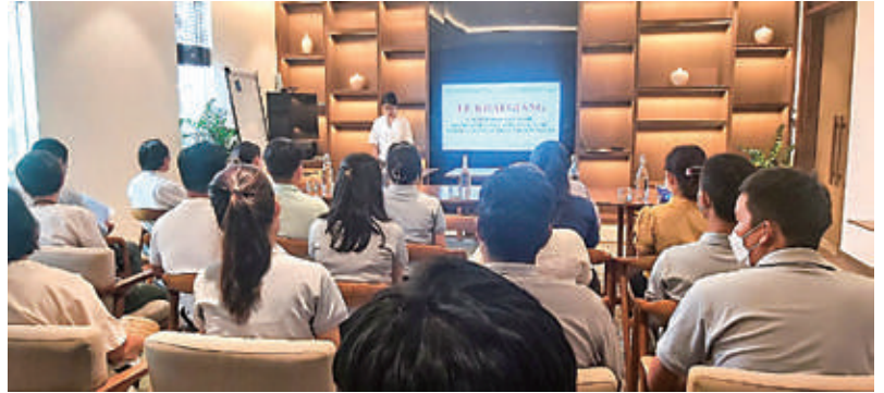
Khai giảng đào tạo nghề tại Cty CP Khu du lịch Biển Maia Quy Nhơn

Ngay sau khi có quyết định phân bổ chỉ tiêu UBND tỉnh, BQL KKT đã triển khai công tác đào tạo nghề và trực tiếp ký hợp đồng hỗ trợ kinh phí đào tạo nghề đến các DN được phân bổ chỉ tiêu. Các DN đã liên kết với các trung tâm có chức năng đào tạo để tiến hành đào tạo nghề cho công nhân lao động được phân bổ chỉ tiêu. Theo mô hình liên kết này, các trung tâm sẽ phụ trách đào tạo phần lý thuyết và hợp đồng với các lao động có trình độ tay nghề