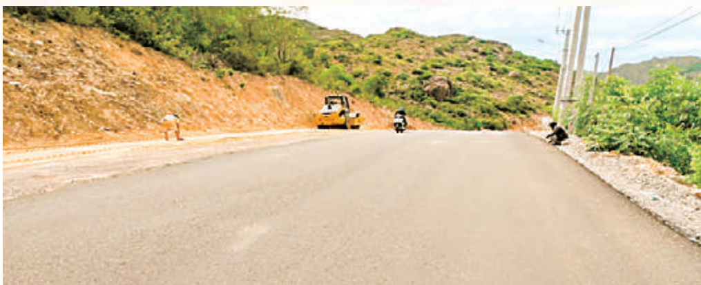
Hiện trường thi công tuyến đường Nhơn Hội - Nhơn Hải (đoạn từ Khu du lịch Hải Giang đến nút giao N1)

1. Công trình Sửa chữa, nâng cấp tuyến đường Nhơn Hội - Nhơn Hải (đoạn từ Khu du lịch Hải Giang đến nút giao N1) với quy mô tiêu chuẩn Đường đô thị, cấp kỹ thuật 30, chiều dài L = 2,583\text{m} , chiều rộng B = 13\text{m} , hiện đã thi công hoàn thành kết cấu nền đường và đang tham nhựa lớp 1, dự kiến sẽ thi công hoàn thành đưa vào sử dụng trước Tết Nguyên Đán năm 2023.