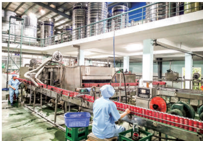
Hoạt động SXKD của Công ty CP nước khoáng Quy Nhơn tại KCN Long Mỹ

Năm 2023, dự kiến tình trạng lạm phát cao ở nhiều nước trên thế giới còn kéo