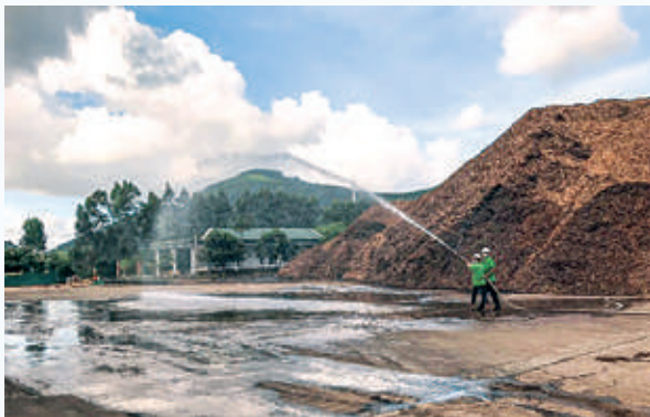
Thực tập phương án chữa cháy và cứu hộ, cứu nạn tại cơ sở