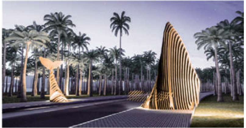
Cổng của khu The THON lấy ý tưởng từ hình ảnh Cá voi xanh xuất hiện tại biển Đê Gi

C ông ty CP Du lịch và Khách sạn Việt Mỹ là chủ đầu tư dự án Khu nghỉ dưỡng Cao cấp Cát Hải Bay (tên cũ là Khu du lịch khách sạn nghỉ dưỡng Vĩnh Hội). Để sớm triển khai dự án và hỗ trợ người dân thôn Vĩnh Hội, ngoài các chế độ, chính sách của Nhà nước đang thực hiện, thời gian qua, Chủ đầu tư đã tổ chức nhiều chương trình hỗ trợ người dân trong khu vực triển khai dự án, như: chương trình đào tạo nghề miễn phí, chính sách ưu tiên tuyển dụng lao động địa phương, bên cạnh đó còn đầu tư xây dựng Khu làng ẩm thực và dịch vụ (tên gọi “The THON”), để người dân địa phương kinh doanh ẩm thực, hàng lưu niệm, đặc sản của địa phương... phục vụ nhu cầu của khách du lịch, với chính sách miễn tiền thuê trong 03