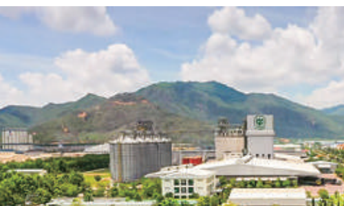
Một góc Khu công nghiệp Nhơn Hòa

Kết quả bình chọn nêu trên nhằm tôn vinh doanh nhân và tập thể người lao động tại các doanh nghiệp đã có nhiều cố gắng vươn lên, đạt nhiều thành tích xuất sắc, cổ vũ tất cả các doanh nghiệp tại KKT và các KCN tiếp tục khắc phục khó khăn, đạt nhiều thành tích xuất sắc trong hoạt động sản xuất kinh doanh, đồng thời chấp hành tốt các quy định hiện hành của Nhà nước, đặc biệt thực hiện ngày càng tốt chế độ chính sách đối với người lao động tại các doanh nghiệp, thúc đẩy doanh nghiệp phát triển bền vững, góp phần xứng đáng vào sự nghiệp xây dựng tỉnh Bình Định.