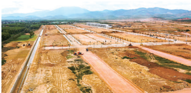
Triển khai xây dựng HTKT KCN Becamex (Canh Vinh, Vân canh)

- Thu hút 19.368 tỷ đồng (đạt tỷ lệ 96,8% kế hoạch năm là thu hút 20.000 tỷ đồng), trong đó cấp mới 20 Dự án (tổng VĐT 4.835 tỷ đồng); điều chỉnh 44 dự án (tăng 14.532 tỷ đồng); thu hồi 11 dự án (giảm 3.837 tỷ đồng). Kết quả thu hút đầu tư chưa được như kỳ vọng đặt ra do trong thực tế triển khai, một số dự án phải chờ thực hiện thủ tục điều chỉnh quy hoạch của KCN trước khi tiếp nhận