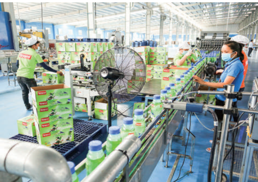
Hoạt động SXKD của Nhà máy sản xuất nước giải khát Tingco Bình Định tại KCN A Nhơn Hội

dài, giá nguyên vật liệu đầu vào, nhiên liệu tăng mạnh; tình hình xung đột ở Ukraina vẫn chưa chấm dứt; nhu cầu thị trường có xu hướng hồi phục nhưng không ổn định,... Sản xuất công nghiệp gặp nhiều khó khăn, lợi nhuận thấp, nhiều ngành phải thu hẹp quy mô sản xuất do nhu cầu thị trường. Đặc biệt là các DN có hoạt động xuất khẩu như ngành chế biến gỗ, chế biến gỗ đang là một trong những ngành chính thúc đẩy SXCN phát triển ( chỉ số SX tăng 7,25% ), lượng đơn hàng đến nay vẫn chưa nhiều, hoặc chưa có đơn hàng, thậm chí hiện nay có một số DN đã tạm dừng sản xuất... Để thực hiện đạt mục tiêu, nhiệm vụ phát triển trong năm 2023 với