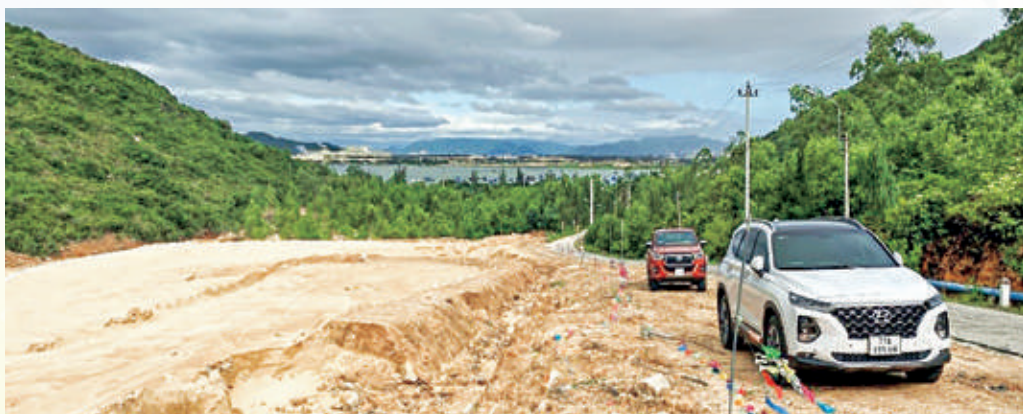
Bàn giao mặt bằng thi công tuyến đường Nhơn Hội - Nhơn Hải

2. Công trình Sửa chữa, nâng cấp tuyến đường Nhơn Hội - Nhơn Hải (đoạn từ Bãi Rỗi đến trạm bơm tăng áp Nhơn Hội), với chiều dài L = 1,590\text{m} , chiều rộng B = 13\text{m} , hiện đã hoàn tất các thủ tục đầu tư và bàn giao mặt bằng cho các đơn vị thi công, triển khai xây dựng tại hiện trường vào ngày 20/12/2022. Thời gian thi công hoàn thành: 10 tháng.