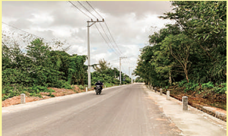
Hiện trường thi công tuyến đường ĐT. 639 (Tuyến Nhơn Hội - Tam Quan) đoạn Km0+450 - Km5+00

Đ ể góp phần đảm bảo an toàn giao thông, đáp ứng theo nguyện vọng của cử tri xã Nhơn Hội, từng bước hoàn thiện hạ tầng kỹ thuật của Khu kinh tế Nhơn Hội theo quy hoạch, tạo thuận lợi cho việc thông thương giữa xã Nhơn Hội với các khu vực lân cận trong Khu kinh tế. Trong năm 2022, UBND tỉnh đã giao Ban Quản lý Khu kinh tế làm chủ đầu tư, tổ chức thi công Sửa chữa, nâng cấp tuyến đường ĐT. 639 (Tuyến Nhơn Hội - Tam Quan) đoạn Km0+450